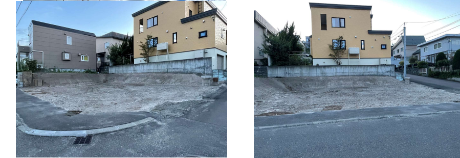
現況と図面が異なる場合は現況を優先いたします。